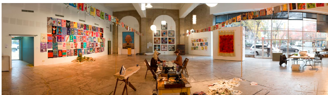
Couverture vivante- Installation Centre A- Vancouver-Canada- Octobre-Novembre 2008

* Michèle André, ancienne ministre du droit des femmes et vice présidente du Sénat. Aujourd'hui, Présidente de la délégation du droit des femmes et à l'égalité des chances.