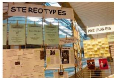
Une exposition sur les stéréotypes et les préjugés est visible au CDI.