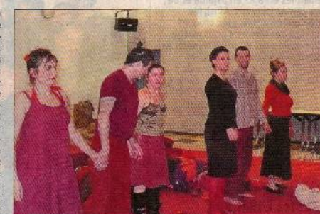
Le spectacle donné mardi après-midi au lycée Marie-Curie par la troupe Les Fées Rosses portait sur les stéréotypes et les préjugés, ainsi que sur les relations femmes-hommes. Les élèves ont ensuite été interpellés sur leur ressenti et ont pu passer de l'autre côté du miroir, rejoignant une scène avec les comédiens.

Le fait de participer à l'issue de la représentation. Sur une mise en scène de Leticia Maganacos, les comédiens évoluent dans un décor minimaliste où les scènes de la vie conjugale : jalousie, prise de pouvoir de l'un sur l'autre, psychodrame intégrant familles, amis, voisins (ici la voisine) trouvent force de conviction. Des jeux de scène astucieux ont été développés avec par exemple l'utilisation d'un drap blanc tendu pour faire écran à une projection d'image du couple, drap ensuite qui les enveloppe comme des momies. Image sublimée d'un amour perdu ? Il y a aussi le jeu très expressif de deux comédiens qui matérialisent les rêves (ou les cauchemars) de deux êtres qui viennent de s'endormir sur leurs angussses et leurs doutes.